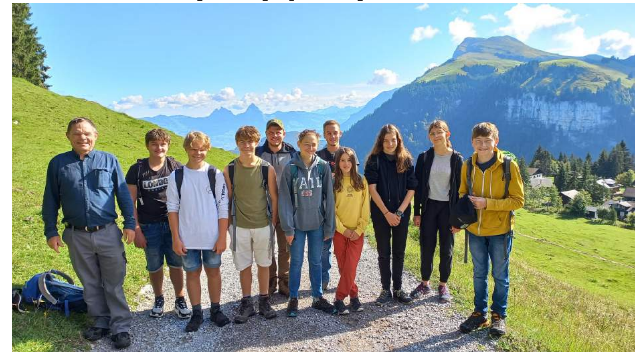
Ausflug mit der Präparandenklasse vom 11. September

Wir freuen uns auf eine rege Beteiligung von Jung und Alt.